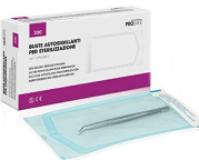
BUSTE AUTOSIGILLANTI X STERILIZZARE 200 pz.H030 * 370.065 * HT090