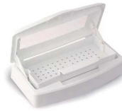
CONTENITORE STERILIZZAZIONE FERRI B021