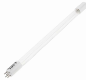
LAMPADA GERMICIDA RICAMBIO B035/L