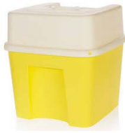
CONTENITORE x RACCOLTA B044