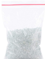
PALLINE QUARZO RICAMBIO