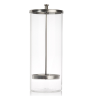
CONTENITORE STERILIZZAZIONE B030 750 ml