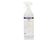
IMPREDIS SOFT DISINFETTANTE FERRI E SUPERFICI PRONTO USO 1000 ml B064